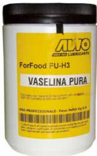
Codice 915.230200 VASELINA PURA 1 KG. conf. 1 pz. Grasso di vaselina puro.